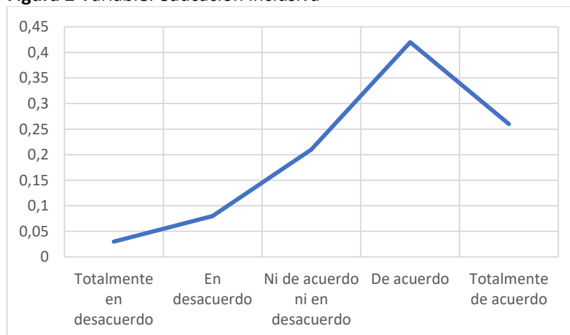
Figura 2 Variable: educación inclusiva

En la tabla 2, la distribución de las respuestas de los estudiantes sobre el desarrollo profesional revela una inclinación positiva hacia su valor en la educación. Un 68% de los encuestados, sumando aquellos que están De acuerdo y Totalmente de acuerdo, reconocen la importancia del desarrollo profesional